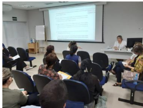
Oficina discussão PRI