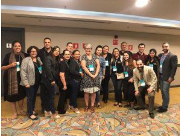
Oficina Rede Colaborativa SP