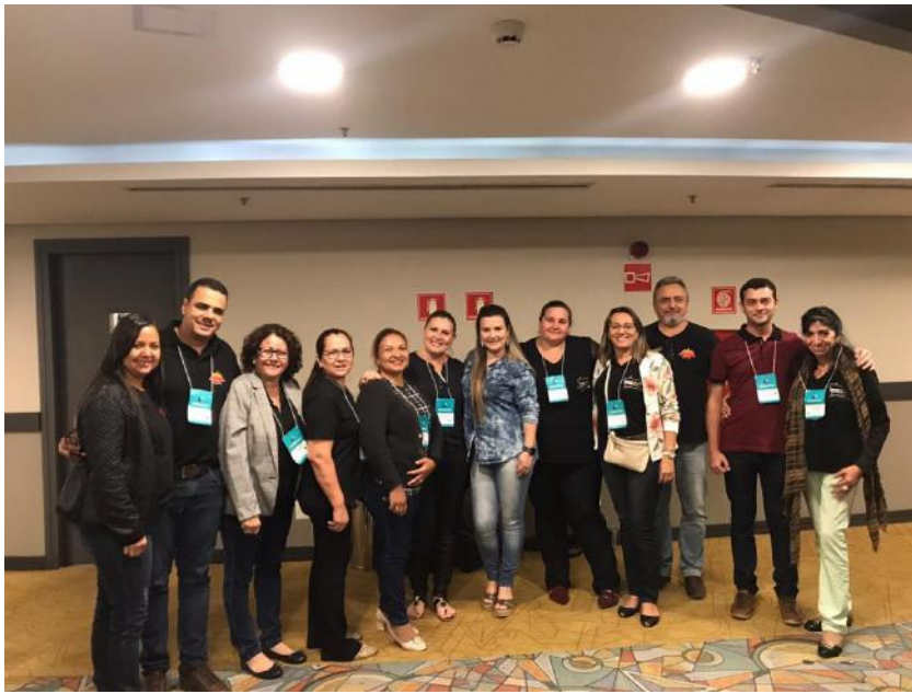
Oficina Rede Colaborativa SP