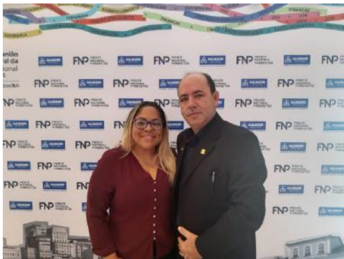
Oficina de Governança – Salvador