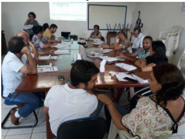
Reunião – CGM-CIR regionais