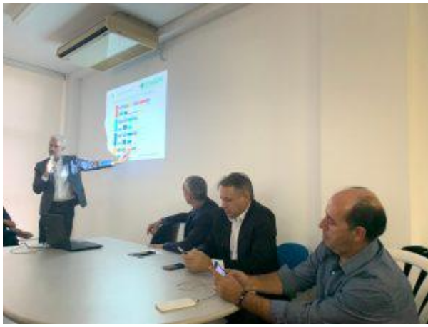
Encontro municipalista, debate novo financiamento.