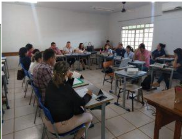
Reunião – CGM-CIR regionais