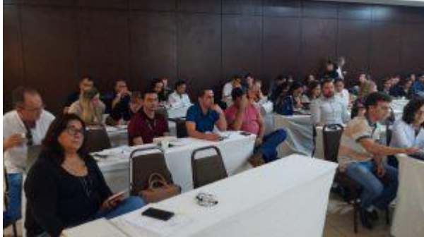
Reunião de Diretoria e CIB